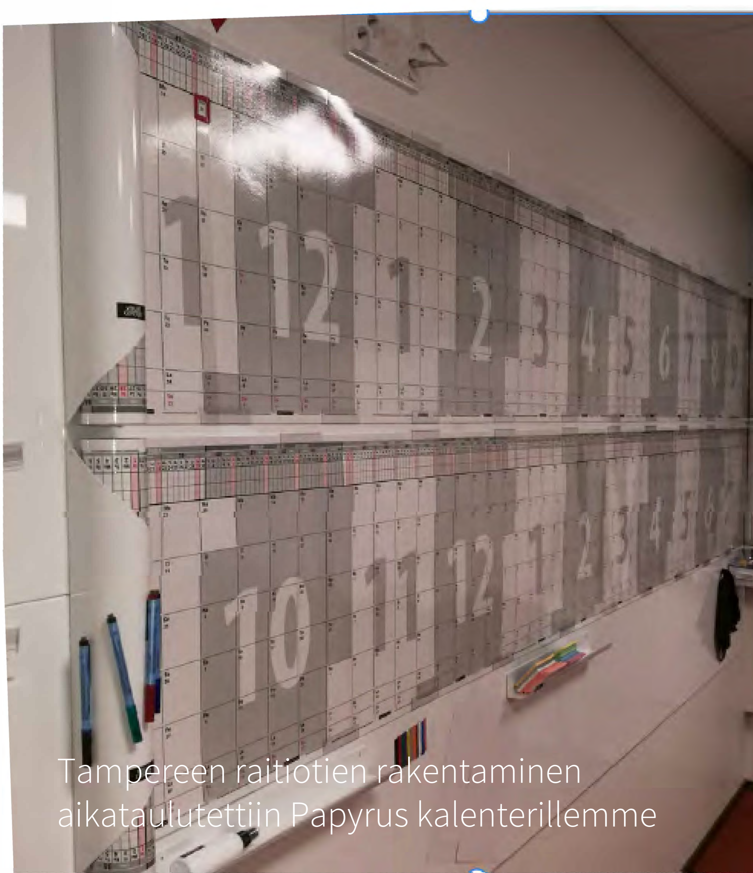
Tampereen raitiotien rakentaminen aikataulutettiin Papyrus kalenterillemme